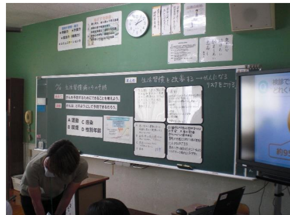
【 保健分野：学習形態の工夫（知識構成型ジグソー法） 】