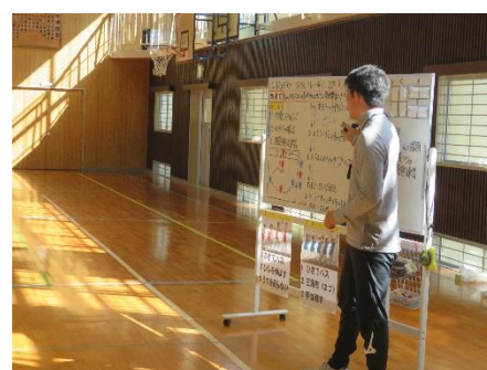
本時の学習の振り返り