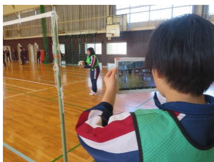
自分や仲間の動きを客観的に認知していく過程