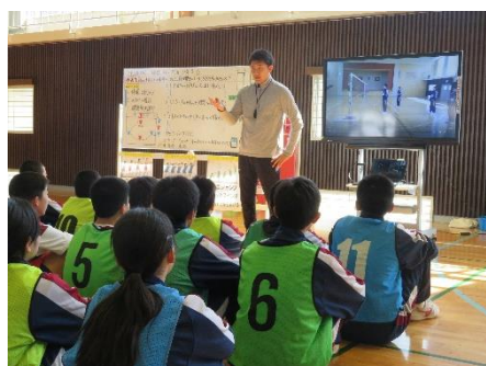
前時の動きを動画で確認