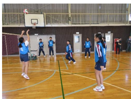
本時の課題を解決(わかる)していく過程