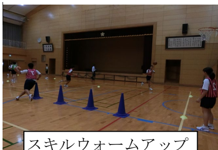
スキルウォームアップ