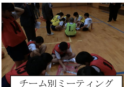
チーム別ミーティング