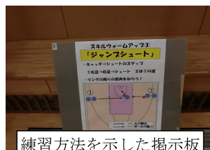
練習方法を示した掲示板

「生徒が意欲的に取り組んでいた」という評価が高く、本時のめあての達成につながる教師の声かけやスキルウォームアップの工夫があった。また、個人学習カードやチームの作戦ボード、練習方法の掲示板などの手立ての有効性が見られた。生徒たちは主体的に運動に取り組み、仲間と協力しながら学習に取り組んでいた。