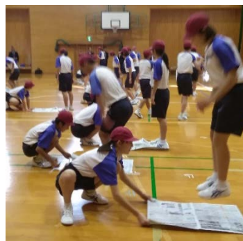
④新聞紙の上を跳んだり、移動しながら行う運動を考えている様子。 (テーマは速さ・力強さ・柔軟性)