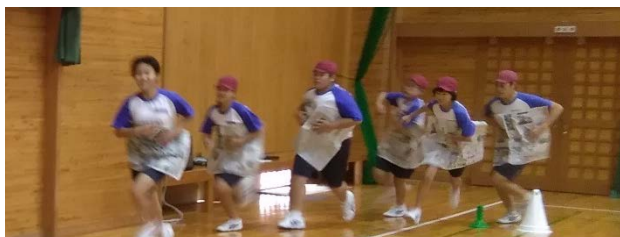
① お腹に貼り付けて走る。 (全身持久力・スピード・動きを持続する)