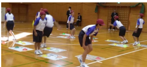
③新聞紙の上を連続ジャンプする。(瞬発力)