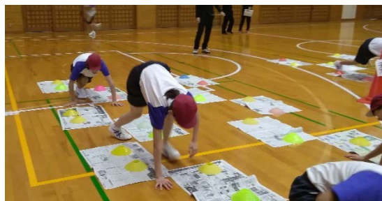
②新聞紙の間と間を移動する。(柔軟性)