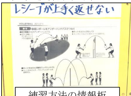
練習方法の情報板