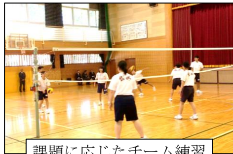
課題に応じたチーム練習