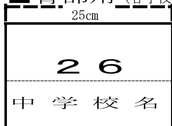
■ 背部用 (各学校作成)